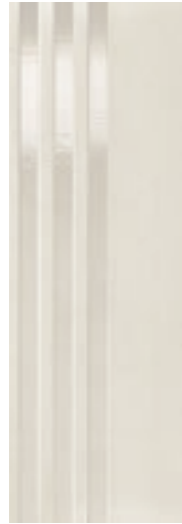
67 760211 Stripe Canvas 24x72