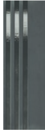
67 760213 Stripe Night 24x72