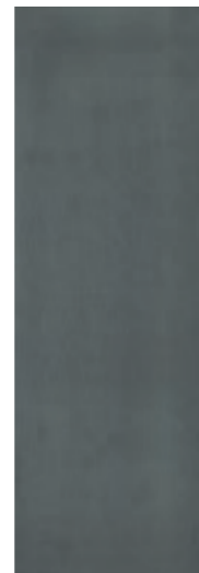
77 760203 Fondo Night 24x72