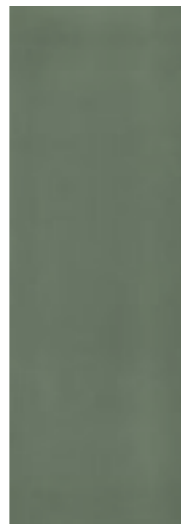
77 760204 Fondo Forest 24x72