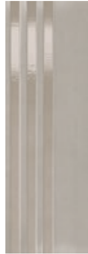
67 760212 Stripe Gris 24x72