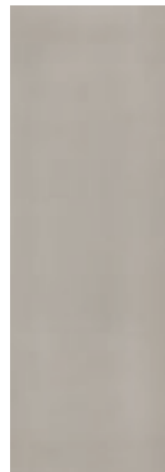
77 760202 Fondo Gris 24x72